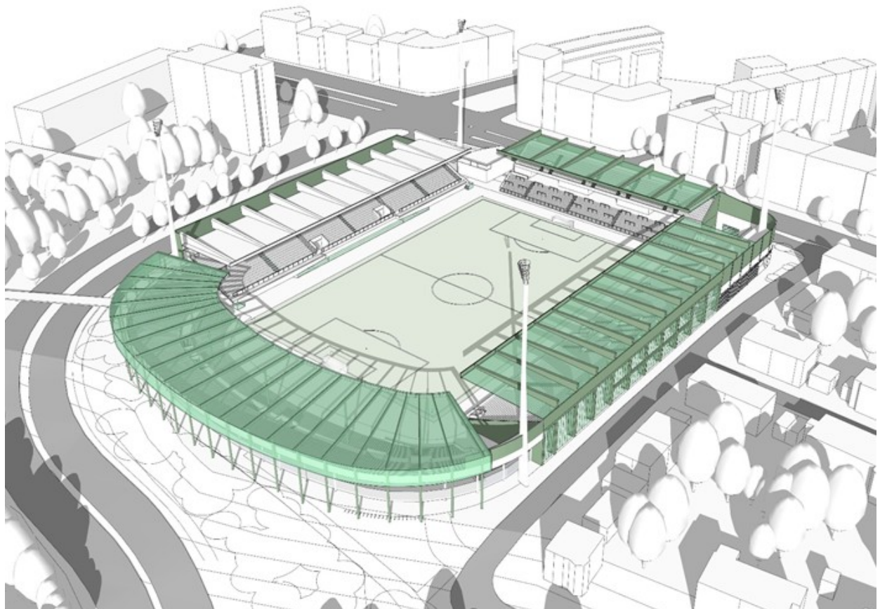
Erweiterungsansatz, Stand Bauvoranfrage – Abbildung: AS+P

Nachdem der Stadtrat mit der Stadtratssitzung vom 24.07.2019 beschlossen hatte, die Genehmigungsfähigkeit für den Erweiterungsansatz zu prüfen, wurde dieser Planungsansatz weiter ausgearbeitet und bildete die Grundlage für den Antrag auf Vorbescheid im Dezember 2019. Die Zuschauerzahl wurde mit Erteilung der rechtskräftigen Bauvoranfrage bestätigt. Der Erweiterungsansatz beinhaltet den Neubau einer erweiterten Haupttribüne auf der südlichen Stadionseite, der sich bis in den Bereich der Westkurve erstreckt. Diese wird anteilig zurückgebaut. Für die Westkurve wird eine Überdachung vorgesehen und die Nordtribüne um zwei Hospitalityebenen erweitert. Die Osttribüne wird auch mit einem neuen Oberrang erweitert und erhält genauso eine Überdachung. Im Bereich Block Q erfolgt ein Teilrückbau, der durch einen tieferen Tribünenneubau unter Einbindung des bestehenden VIP-Raumes kompensiert wird. Außerdem wird das Spielfeld Richtung Norden verschoben. An den Stadionecken sind abschirmende Wanderhöhlungen vorgesehen, um den Schallschutz zur Nachbarschaft zu verbessern. Um den Anforderungen zur Verbesserung der Fanströme außerhalb des Stadions gemäß Antragspunkt 3 des Beschlusses des Stadtrates vom 24.07.2019 (Sitzungsvorlage Nr. 14-20 / V 15688) zu entsprechen, werden die Eingänge im Süden und Osten neu organisiert und in der Folge auch der Behördenhof mit Erweiterung der Polizeiwache und neuer Anbindung der Leitstelle.