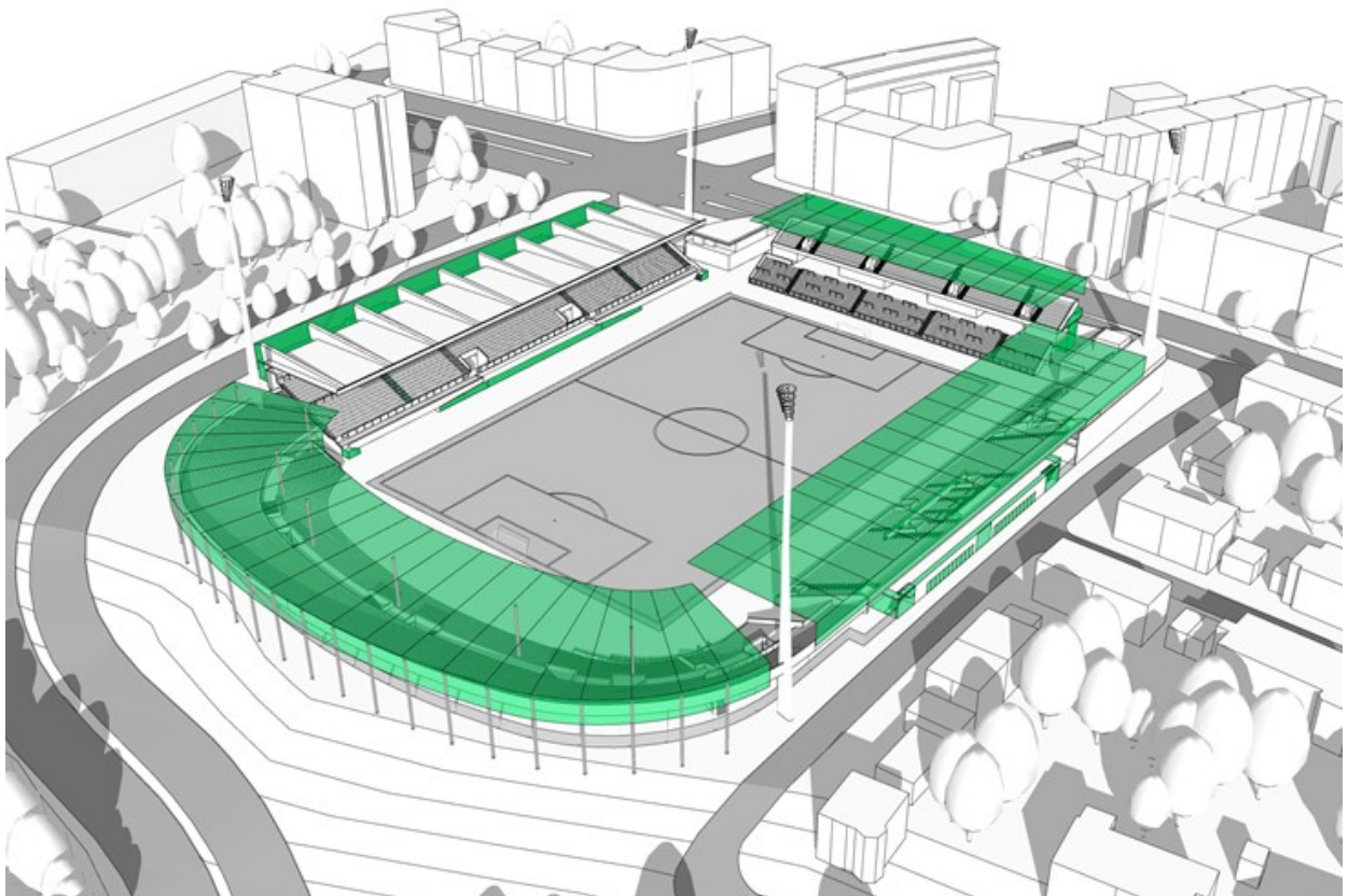
Grundansatz – Abbildung: AS+P

Für den Grundansatz wurde vom Büro AS+P eine Kostengrößenordnung ermittelt, die in der Anlage zum Beschluss zur Machbarkeitsstudie vom 24.07.2019 enthalten war. Diese Berechnung hat zu diesem Zeitpunkt noch nicht alle Erfordernisse vollumfänglich berücksichtigt. Deshalb wurde diese Kostengrößenordnung auch für den Grundansatz entsprechend mit Nebenkosten und der Reserve für Planungsrisiken ergänzt und auf den aktuellen Baupreisindex aktualisiert.