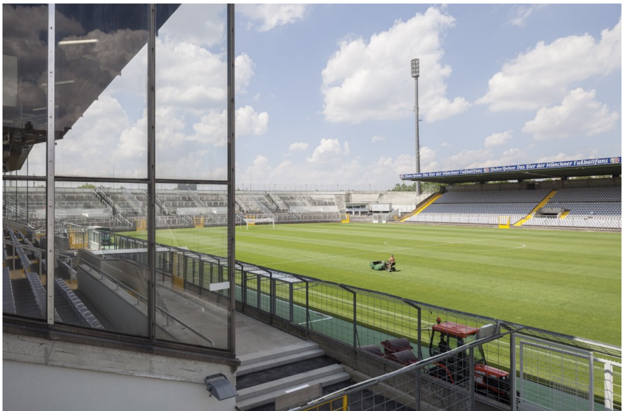
Blick von Block Q zur Haupttribüne, Westkurve und Nordtribüne

Für den Anteil dieser Sanierung an der Gesamtmaßnahme wurde lediglich eine Kostengrößenordnung ermittelt. Um eine qualifizierte Kostenschätzung erstellen zu können, sind umfassende Untersuchungen der Gebäudesubstanz und eine Vorplanung notwendig. Im Beschluss zur Machbarkeitsstudie vom 24.07.2019 (Sitzungsvorlage Nr. 14-20/V 15688), die sich nur mit den Bereichen der Erweiterung auf 18.060 Zuschauer*innen befasste, waren diese Maßnahmen noch nicht berücksichtigt und sind als Teilkosten „Sanierung Bestand“ bei allen nachfolgenden Planungsansätzen zu den Teilkosten „Ertüchtigung“ hinzuzurechnen. Die grundlegenden Maßnahmen zur Sanierung zielen zunächst auf den Erhalt der Drittligatauglichkeit ab. Eine höhere Ligatauglichkeit wird erst mit den nachfolgend beschriebenen Planungsansätzen ermöglicht.